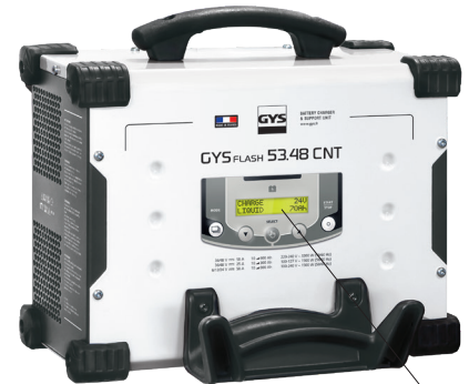
Интуитивно понятный интерфейс на 22 языках